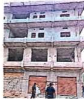
मारुति नगर में अवैध निर्माण को सील करने वीडिए की टीम