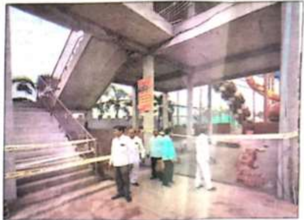
अज्ञात मशीन। उन्होंने कड़ा एक्शन लेते हुए वार्ड सुब्रह्मण्य को सख्त प्रभाव से क्षेत्र में वैधान धनुष सेवी कार्रवाई करते प्रकट, निर्माण कर 15%।

नगर, सामने घाट (मदरवा), गढ़वा घाट रोड पर किये गए बड़े अवैध निर्माणों का उपाध्यक्ष को औपचारिक निरोधन कराया। उन्होंने अवैध निर्माणों के विरुद्ध प्रवर्तनकर्ता पर प्रवर्तन दल को कार्रवाई करने को कहा। कोर्टोए उपाध्यक्ष ने क्षेत्र के जोनाल अधिकारी एवं अवर अभियंता के अपने पदेन दायित्वों का निर्वहन न करने पर उनकी कतार लगाई और इस मामले में प्रवर्तन कार्यवाही में अग्रणी स्थितिगत परते जाने पर उनका वेतन रोकने जाने का निर्देश दिया। इसके लेबर उन्होंने लगभगवाही करते जाने और नकाराधी पर विभाग के उक्त जिम्मेदार अधिकारी को कारण बताओ नोटिस जारी कर