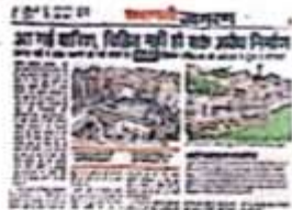
दैनिक जागरण में 5 जुलाई को प्रकाशित खबर • जवाहर