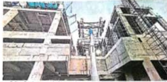
काली विद्यापीठ में चल रहा रोपवे का कार्य - जागरण

जागरण संवाददाता, वाराणसी : देश के पहले अर्बन ट्रांसपोर्ट रोपवे प्रोजेक्ट का ट्रायल रन नवंबर में होगा। इस दिशा में बुद्धमंथर पर कार्य हो रहा है। सिविल इंजीनियरिंग से आठ किमी रोप का आरंभ हो चुका है। पहले चरण की परियोजना के लिए यह संपूर्ण खेप है। इस चरण में तीन स्टेशन स्वीकृत हैं, जिनमें कैट, भारत माता मंदिर और रथयात्रा शामिल हैं। भारत माता मंदिर और रथयात्रा का सिविल कार्य (स्ट्रक्चर फिल्लिंग) शत प्रतिशत पूर्ण हो चुका है।