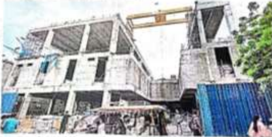
रथयात्रा पर चल रहा रोपवे का कार्य - जागरण

फिल्लिंग का रंगरोमन, पत्थर लगाना और कार्पिंग समेत कई दूसरे कार्य शुरू किए जा चुके हैं। कैट स्टेशन के निर्माण में 50 प्रतिशत प्रगति है। अगले महीने अगले कार्य पूर्ण करने का लक्ष्य रखा हुआ है। पहले फेज में स्टेशन और टावरों में 50 से अधिक वोल्टेज रोल्स (पक्की) का प्रयोग होगा, सितंबर में इनकी आरंभ होगी क्योंकि रोप इसी महीने के सत्रह शुरू होगा। कैट से रथयात्रा तक सात टावर लगाए जा चुके हैं, दो टावर अगले माह लग जाएंगे। सिविल इंजीनियरिंग की कंपनी कांस्ट्रक्टेड 36 मीटर लंबे टावर स्थापित कर रही है।