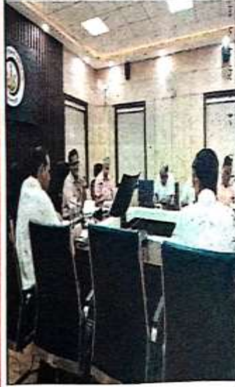
बेसमेंट के निर्माण में सभी मानकों को मसुदा किया गया है।

मानक के अनुरूप कार्य कराने के लिए शासन ने दिया एक अवसर दिल्ली में बेसमेंट घटी घटना को देखते हुए शासन-प्रशासन पूरी तरह शक्ति में आ गया है। सोमवार को शासन अपर मुख्य सचिव आवास एवं शहरी नियोजन के निर्देश जारी किया है कि बेसमेंट में चल भात में कन्हानी को देखते हुए प्राधिकरण विनियमित क्षेत्र भवनों के बेसमेंट के निर्माण में सुरक्षा कपास सुनिश्चित करें, बोन के बाद ही आवश्यक कार्रवाई को जाये। इसमें प्रमुख रूप से सुरक्षा का उपाय महत्वपूर्ण है, शासन निर्देश में जूनियर अधिकारी, सहायक अभिपंता और अवर अभिपंताओं को टीम बंट करते हुए विभिन्न आवासों में बने बेसमेंट बाकी स्थल पर निरीक्षण किया जाये एवं अवैधानिक गतिविधियों के नियंत्रण पर सुरक्षा उपाय सुनिश्चित करें। निरीक्षण में इस बात का विशेष रूप से प्राथमिकता दी जाये कि बेसमेंट का निर्माण मानकों के अनुरूप किया गया है। इस प्रकार के मानचित्रों को तभी स्वीकृत दिये जाये, जब