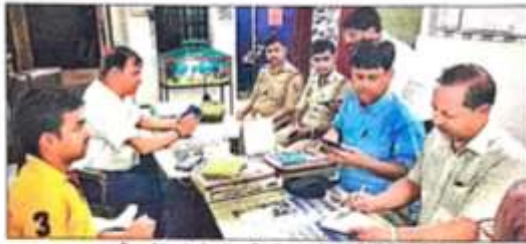
सख्त अवरुद्धी दुर्घटना के बेसमेंट की जांच करने पहुंची वीडिए की टीम। संवाद

बेसमेंट का इलेक्शन सही करवाई अधिचारी: वीडिए उपसभ्य सुरक्षित गर्म ने मंगलवार को बैठक कर प्रवर्तन टीम को अहंता दिए कि हर जगह में जांच कर कार्रवाई करें। साथ ही पंचायत जांच का तीन दिन के