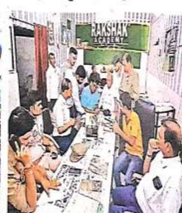
रविंद्रपुरी मार्ग पर बेसमेंट में चल रहे डे स्कूल एकेडमी को सील करने एड्यूकेटिव अधिकारी व पुस्तकालयी • जागरण