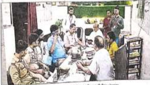
रवींद्रपुरी स्थित कोचिंग सेंटर की संसदवादी को नोटिस जारी करने के बाद सख्त कार्रवाई की जा रही है।