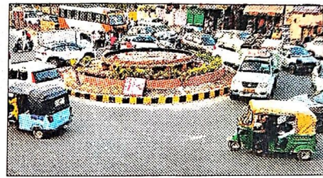
फुलवरिया तिराहा। संवाद

यहां पर वाहनों का टकराव न हो इसके लिए हरियाली के साथ लाइटिंग की व्यवस्था की जा रही है। वीडिए की ओर से इस तिराहे को खिलाड़ियों के हब के रूप में विकसित किया जा रहा है। यहां पर 7-7 फीट की दो हॉकी स्टिक लगाने के लिए बेस तैयार किया जा रहा है। इसके अलावा बेंच, स्कल्पचर आदि का निर्माण कराया जाएगा। पिछले दिनों महाकुंभ से आने वाली भीड़ के चलते काम रुक गया था। अब वीडिए उपाध्यक्ष पुलकित गर्ग की हिदायत के बाद काम तेज कर दिया गया है।