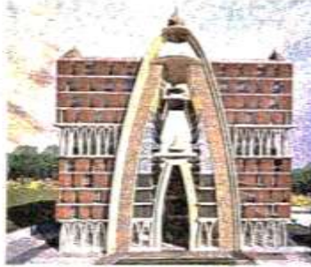
शुरुआत में 20 मंडलीय कार्यालयों का समूह भवन

निर्माण को शीघ्र समाप्ति से हरी झंडी, कैबिनेट की मंजूरी तक ही शुरू हो जाएगा काम, विकास प्राधिकरण ने शुरुआत की है।