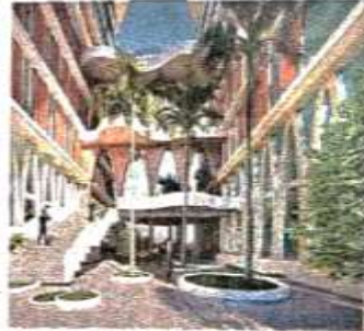
शुरुआत में 10 मंडलीय कार्यालयों का समूह भवन

मंत्री परिषद की कैबिनेट बैठक में लगेगी मंजूरी एकौड़ मंडलीय कार्यालयों के लिए अगर मुख्य मंत्रियों के बीच विचारों की अन्तर्गत में मंडलीय कार्यालयों का निर्माण शुरू करने पर सहमत हो जाय तो इस पर अंतिम तय से मंजूरी मंत्री परिषद की कैबिनेट बैठक में लिया जाना है।