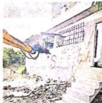
विकास प्राधिकरण की तरफ से की जा रही ध्वस्तीकरण की कार्रवाई : वीडोए

सामने घाट पुल के नीचे वैष्णवी इंटरप्राइजेज बिना मानचित्र स्वीकृत कराए निर्माण करा रहा था। 387 वर्गफीट के क्षेत्रफल में पूर्व निर्मित भूतल के प्रथम तल पर ढलाई का कार्य पूर्ण कर फिनिशिंग का कार्य किया जा रहा था। पहले तो इसका नक्शा पास नहीं था दूसरे यह 200