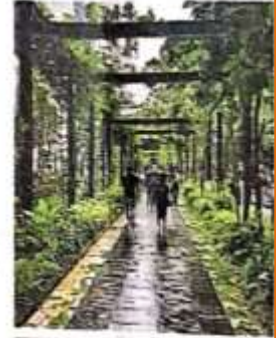
माडल फुटपाथ • जगदण

गए। दोनों तरफ पर्याय मात्र में हेकोरेटिव साइट लगाई जाएगी। बार्डोरो काल पर शहर से संबंधित प्रमुख स्थानों के सड़नेज बोर्ड भी लगाए जाएंगे। इस सब कार्य के लिए राजस्व विभाग, नगर निगम, लोक निर्माण विभाग, प्राधिकरण और कैटोनमेंट बोर्ड की सामूहिक टीम कैटोनमेंट लीड का सर्वे करेगी। कैटोनमेंट के साईंओ भी मौजूद रहे।