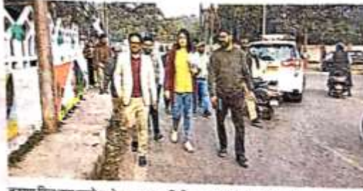
वरुणा ब्रिज तक बनने वाले फुटपाथ का निरीक्षण करते वीडिए अधिकारी