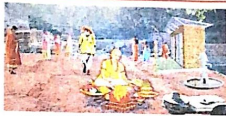
दसवां स्थल के सुंदरीकरण के लिए प्रस्तावित माडल • जागरण

• दसवां स्थल की जमीन कब्जा करने और उसे बेचने के मामले आए सामने