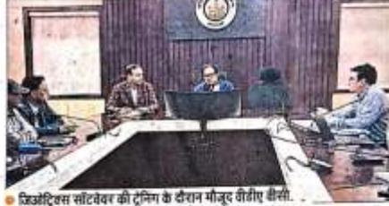
जियोट्रिक्स सॉफ्टवेयर की ट्रेनिंग के दौरान मौजूद वीडिए वीसी.

सॉफ्टवेयर के तकनीकी नेतृत्वकर्ता एडवॉंस सैटेलाइट परिवर्तन सॉफ्टवेयर द्वारा नियोजित विकास में नई तकनीक के बारे में एक्सपर्ट्स ने जूनल अधिकारियों और अवर अधिकारियों को प्रशिक्षण दिया। उन्होंने सॉफ्टवेयर की कार्यप्रणाली और इसकी क्षमताओं को विस्तार से समझाया। सॉफ्टवेयर का उपयोग न केवल अवैध निर्माणों को पहचान के लिए होगा, बल्कि यह जानकारी भी देगा कि शहर में नए प्लॉटिंग कहां-कहां हुई हैं।