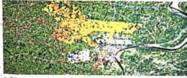
जियोट्रिक्स साफ्टवेयर से कुछ इस तरह दिखता है चौड़ीए का सीमा क्षेत्र