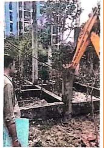
अवैध निर्माण तोड़ना बुलडोजर