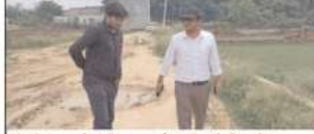
निरीक्षण के दौरान अवैध निर्माणों को ध्वस्त व सील कराते वीडीए वीसी पुलकित गर्ग

वीडीए उपाध्यक्ष पुलकित गर्ग की मौजूदगी में बुधवार को वाराणसी विकास प्राधिकरण वाराणसी जोन-3 की प्रवर्तन टीम ने अवैध निर्माण के विरुद्ध 10 बीघे का ध्वस्तीकरण एवं 6