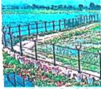
हरहुआ में उंदी ताल को पर्यटन की दृष्टि से विकसित करने की योजना • जागरण

उंदी ताल पर आसपास के लोगों का कब्जा था। जिला प्रशासन से उंदी ताल और आसपास की 78.5 एकड़