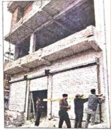
शिवपुर में कार्रवाई करती टीम।