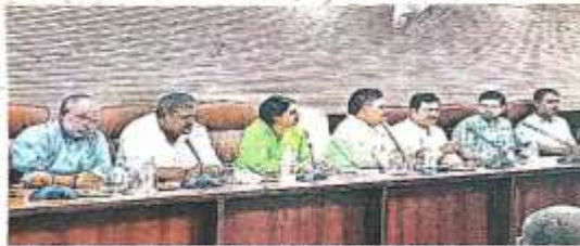
सर्किट हाउस में प्राज्ञान और जनप्रतिनिधियों के बीच हुई समन्वय बैठक में मुख्य विभा

जागरण संवाददाता, वाराणसी : स्टॉप राज्य मंत्री रवींद्र जायसवाल ने कहा कि बिजली विभाग तीन वर्ष पूर्व बांस-बल्ली के स्थान पर 10,000 पोल लगाने की योजना बनाई थी। जिलाधिकारी उसकी जांच कराकर उसमें कमी पाए जाने पर संबंधित अधिकारियों के खिलाफ कड़ी कार्रवाई करें। साथ ही निर्देश दिया कि लटक रहे बिजली तारों को स्टील पोल के माध्यम से व्यवस्थित करवाए ताकि भविष्य में कोई दुर्घटना न हो।