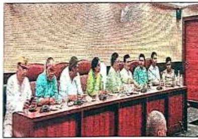
सिटी हाउस में बैठक में मौजूद राजमंत्रियों की बैठक में शहर के विकास और अन्य। शहर-सुधार विभाग

उन्होंने कहा कि अलग-अलग तरह की समीक्षा और