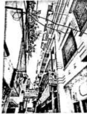
चेतगंज वार्ड के मंसाराम मोहल्ले में बना अवैध अपार्टमेंट