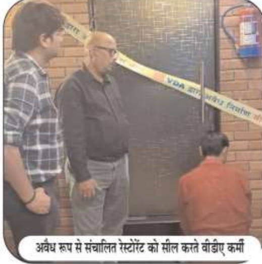
अवैध रूप से संचालित रेस्टोरेंट को सील करते वीडिए कर्मी

तरुणमित्र न्यूज वाराणसी। वीडिए उपाध्यक्ष पुलकित गर्ग के निर्देश पर वाराणसी विकास प्राधिकरण वाराणसी जोन-3, वार्ड-दशास्वमेध के अंतर्गत सिगरा स्थित भवन संख्या D-58/19 A-4 में अवैध निर्माण और पार्किंग में अवैध रूप से संचालित रेस्टोरेंट का वीडिए सचिव डॉ वेद प्रकाश मिश्रा द्वारा 18/09/2024 को स्थल निरीक्षण किया गया था तथा भवन स्वामी को उक्त बेसमेंट में संचालित रेस्टोरेंट को बंद कर पार्किंग के लिए उपयोग में लाने के लिए आदेशित किया गया था परन्तु वर्तमान में भी पार्किंग में अवैध रूप से संचालित रेस्टोरेंट पाए जाने पर उक्त