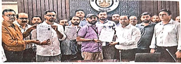
एक मुश्त समाधान योजना के लाभार्थियों को प्रमाणपत्र देते वीडिए सचिव डा. वीपी मिश्रा

अध्यक्षता कर रहे वीडिए सचिव डा. वीपी मिश्रा ने बताया कि योजना के तहत आवासीय व व्यावसायिक भवन आवंटित कराने के साथ कई लाभार्थी बकाया राशि जमा नहीं कर पाए थे। उस राशि पर ब्याज अधिक होने के चलते कई आवंटी बकाया राशि जमा नहीं कर पा रहे थे। ऐसे लोगों को लाभ पहुंचाने के लिए ओटीएस योजना लाई गई है। इस योजना से बकाएदार आवंटियों को बकाया राशि जमा करने के साथ