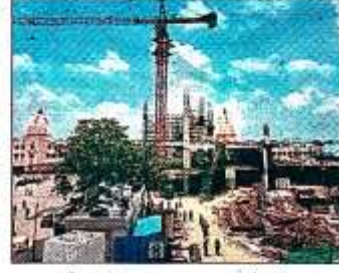
कैंट स्टेशन पर चल रहा रोपवे का काम।

कार्यदायी एजेंसी एनएचएलएमएल ने बताया कि टावर संख्या 5 से 13 के बीच केबल न हटने का कारण काम