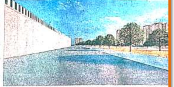
मोहनसराय में ट्रांसपोर्ट नगर योजना का माडल • जागरण

25 वर्ष तक सड़क खराब नहीं हो, इसके लिए विशेष सुझाव देगी। सड़क 45 से 50 टन तक लोड सहने की क्षमता वाली होगी। सीवर लाइन डालने के साथ चौड़ीए सड़क पर मिट्टी डाल चुकी है, बारिश खत्म होते ही सड़क बनाने का काम शुरू करेंगे। ट्रांसपोर्टों को प्लाट आवंटित करने के लिए इस माह के अंतिम सप्ताह में विज्ञापन निकाला जाएगा।