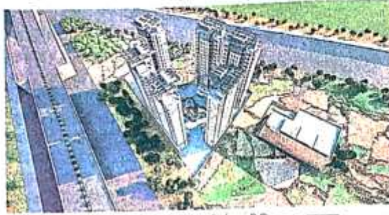
मोहनसराय में ट्रांसपोर्ट नगर योजना में बनने वाले टॉवर की डिजाइन • जागरण

वाराणसी : मोहनसराय में बसाया जा रहा ट्रांसपोर्ट नगर वाराणसी विकास प्राधिकरण का ड्रीम प्रोजेक्ट है। प्राधिकरण अपने ड्रीम प्रोजेक्ट को पूरा करने के साथ उसकी गुणवत्ता पर कोई सवाल नहीं उठे, इसको लेकर बीएचयू आइआइटी से एमओयू किया है। आइआइटी बनाए गए ड्राइंग को देखने के साथ ट्रांसपोर्टों की सुविधा को भी देखेगा।