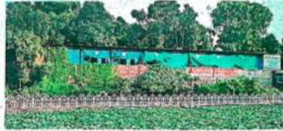
वरुणा नदी के दूब क्षेत्र में साढ़े सात हजार वर्ग फीट में बना वैक्वेट हाल

27 जुलाई को वीडिए ने क्षतिग्रस्त कर होटल किया है सील। बुद्ध विहार कालोनी में अवैध तरीके से बने होटल बनारस कोठी और रिवर पैलेस के खिलाफ ध्वस्तीकरण का आदेश