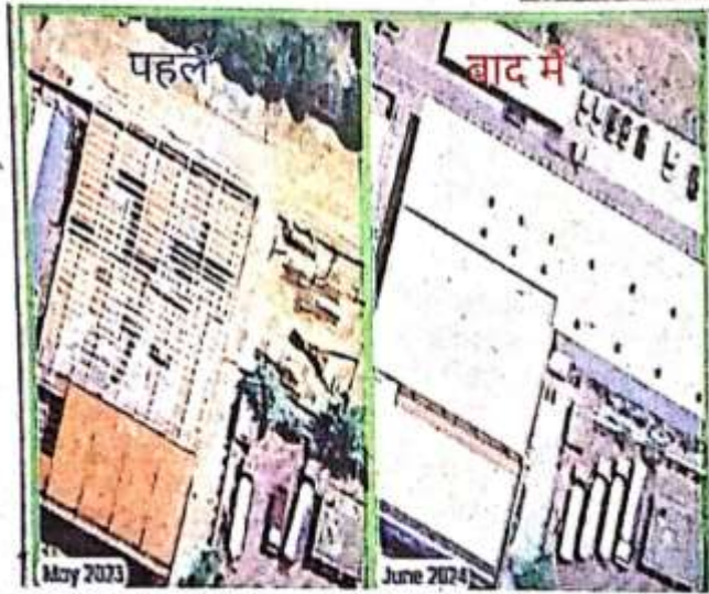
शहर के सिकरील वार्ड में सेटेलाइट सर्वे में चिह्नित हुए अवैध निर्माण।

वीडोए सीमा क्षेत्र में अवैध निर्माण की तुलना में 10 प्रतिशत भी नक्शा पास नहीं हो रहे हैं। अवैध तरीके से जमीन प्लार्टिंग की कोई गिनती नहीं है। वीडोए महीने में 15 से 20 से अवैध जमीन की प्लार्टिंग तोड़ने की कार्रवाई कर रहा है लेकिन उस तुलना में बंद नहीं हो रहे हैं। हालात यह हैं